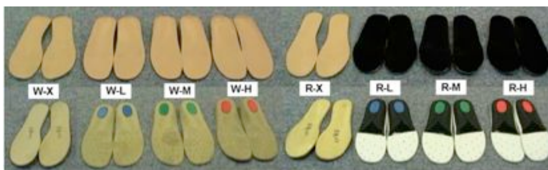
图 2 三维控足鞋与足弓支撑鞋垫

香港的学者认为运动控制鞋在运动时比静态下能够更好的起到改善异常外翻的功能，因为静态下双足同时支撑体重，健侧足能够起到代偿作用，而在运动状态下特别是患足的单侧支撑期时，由于身体的重量全部由患足承受而无法由健侧代偿，这时对内侧足弓的支撑变