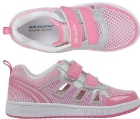
图 3 Dr Kong 江博士三维护足运动鞋

得尤为有效[9]。所以在实验中，于走路时足弓支撑鞋垫能使 84%后足外翻的孩子外翻角度回复至正常范围。而后足外翻情况的控制将纠正足部的异常运动模式，让足部肌肉更好地协同完成日常必需的各种活动，减少疲劳状态发生的可能性。而这样的一双厂家专业定制的三维护足鞋和鞋垫的费用大约是 239—399 元左右。